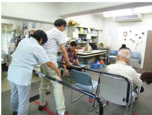
機能訓練に特化した通所介護。 個々のプログラムに基づいて指導します。

そして2000年の介護保険制度創設にむけて、介護支援専門員（ケアマネジャー）の資格制度が始まることを知り、猛勉強の末、1999年にケアマネジャー1期生として資格を取得。本格的に介護事業への参入を決め、その後、通所介護の事業所もスタートさせました。通所介護とは、一般的に日帰りの介護施設で、入浴や食事、機能訓練などのサービスを行っていますが、入浴と食事のサービスをなくし、 機能訓練に特化した新しいスタイルの通所介護 です。このスタイルですと、鍼灸治療院を少し拡張し、バリアフリーに改装する程度で対応できるため、介護事