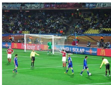
〔 日本代表の決勝トーナメントを決めたデンマーク戦の様相 〕