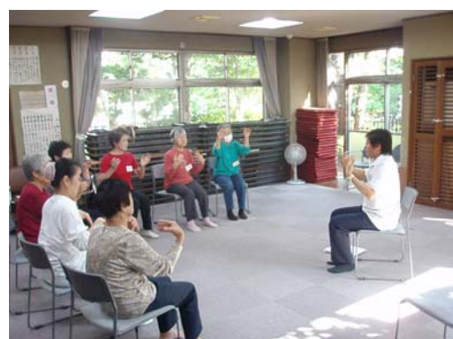
家でもできる簡単な体操。 無理をしないのが続ける秘訣。