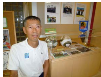
学校の入り口にはワールドカップ時のレポートやグッズが展示されている