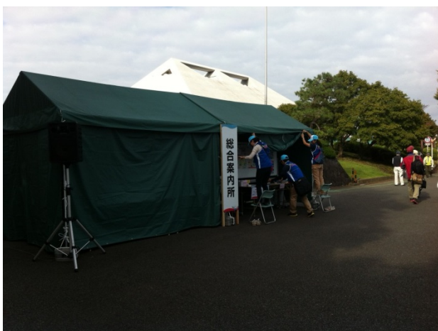
テニス競技会看板の右奥に総合受付があります。 早朝なので準備中。