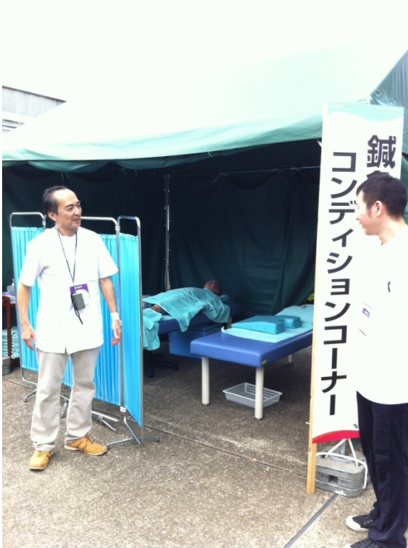
奥で治療を受けているのは高田会長です。 昨日の開会式で5時間座り続けて腰痛です。