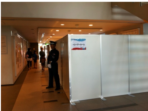
トレーナールーム