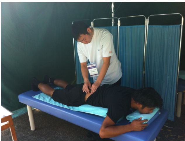
秋元先生、施術に入りました。