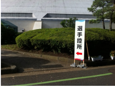
総合受付のさらに奥に選手控所の看板