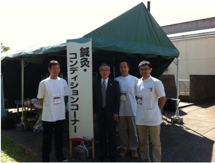
午前中、高田会長、陣中見舞い来て下さいました。