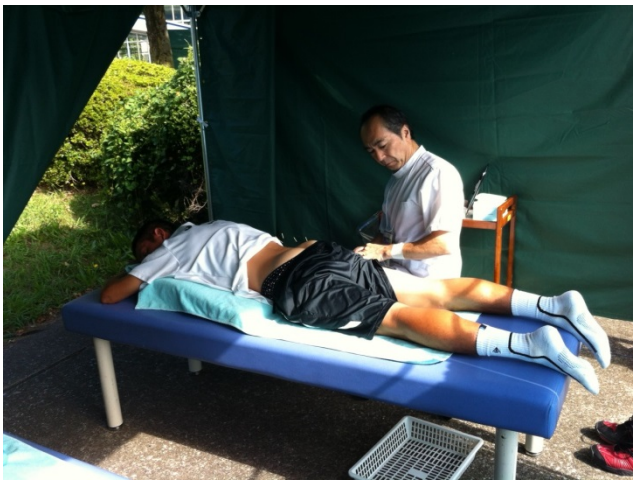
藤井先生も施術に入りました。