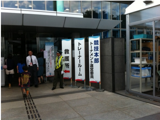
トレーナールームと救護所

アイシングが必要な場合はトレーナールームへ 救護所にはドクターがおりますので重傷者は救護所へお送りください。