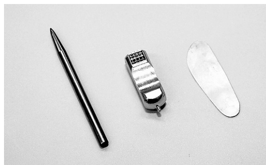
3種の皮膚鍼使用がきわめて有効