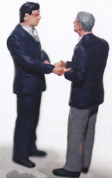
未入会の方の保険取り扱い開始までの流れ